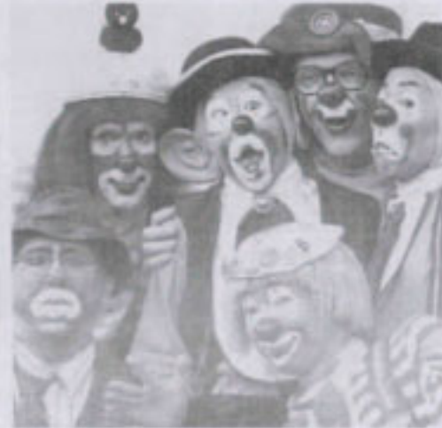
Giocolieri e mangiafuoco arriveranno a Valverde insieme a tanti artisti di strada