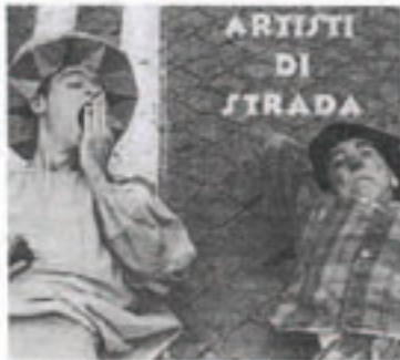
Artisti di strada di scena domenica a Valverde

Il Festival Provinciale Itinerante di Teatro di Figura è organizzato dall'assessorato alla cultura della Provincia di Pavia e dall'Associazione "Peppino Sarina" con il patrocinio della Regione Lombardia e sempre all'interno di questa manifestazione è previsto per domani, alle ore 16, un laboratorio di costruzione di pupazzi e uno spettacolo serale di burattini e pupazzi con la compagnia Roggero-Rizzi e Scala.