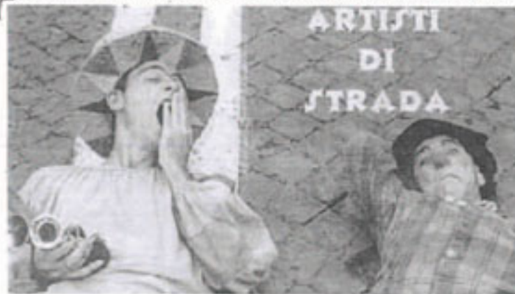
Il manifesto che pubblicizza l'evento che si terrà domani pomeriggio a partire dalle 16

Appuntamento domani a Borgo di Calghera Superiore, vicino a Valverde